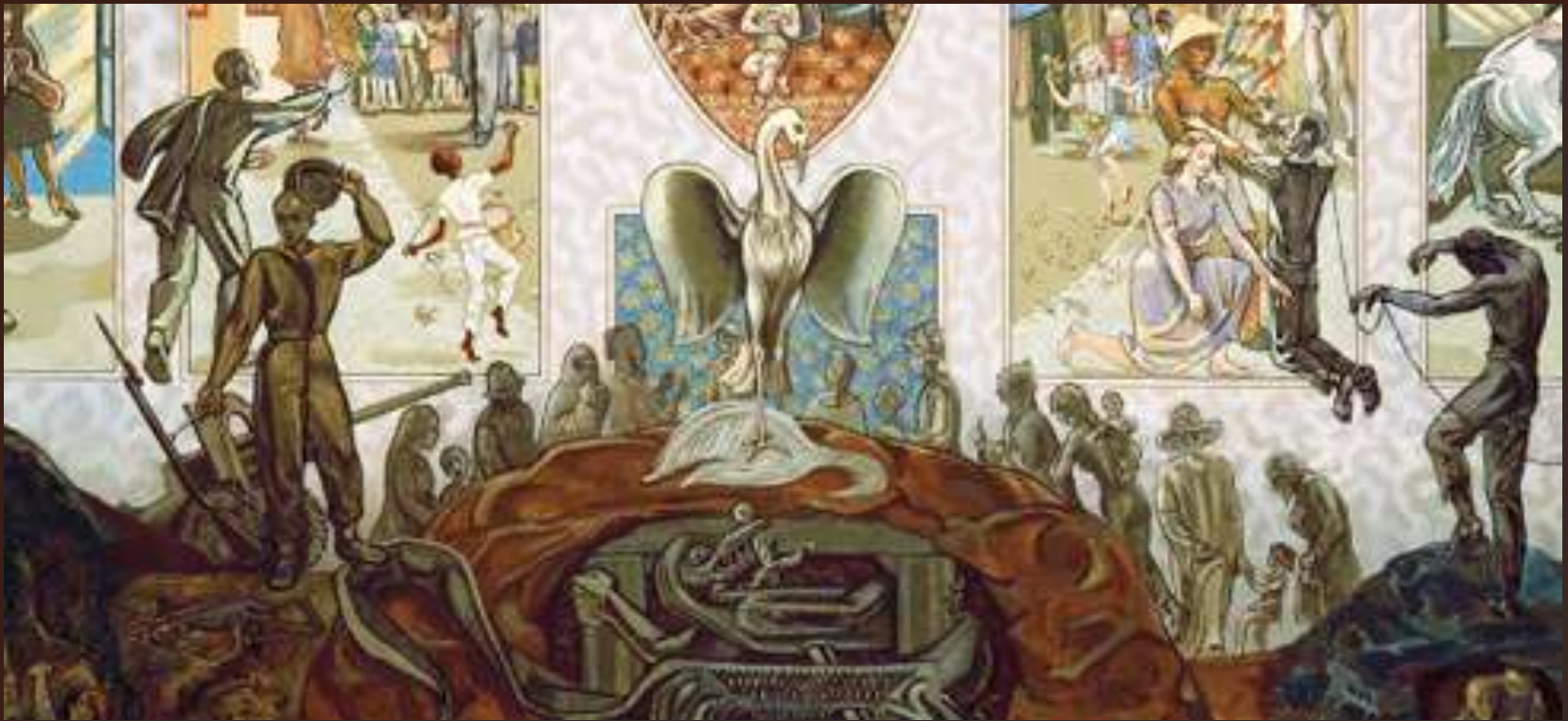
Tableau mural du siège de l'ONU